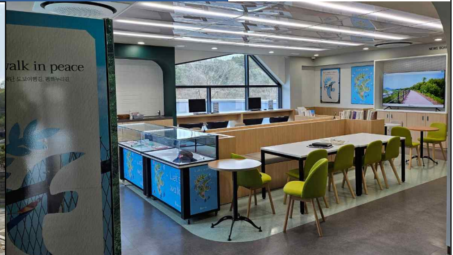
2층 커뮤니티 공간